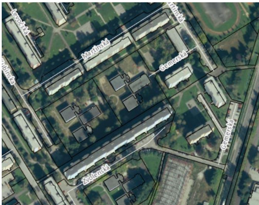
Obr. 3: Vnútroblok Zvolenská/Martinská.