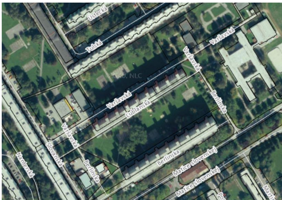
Obr. 1: Vnútrobloky Tulska/Varšavská, Lubl'anská/Berlínska.