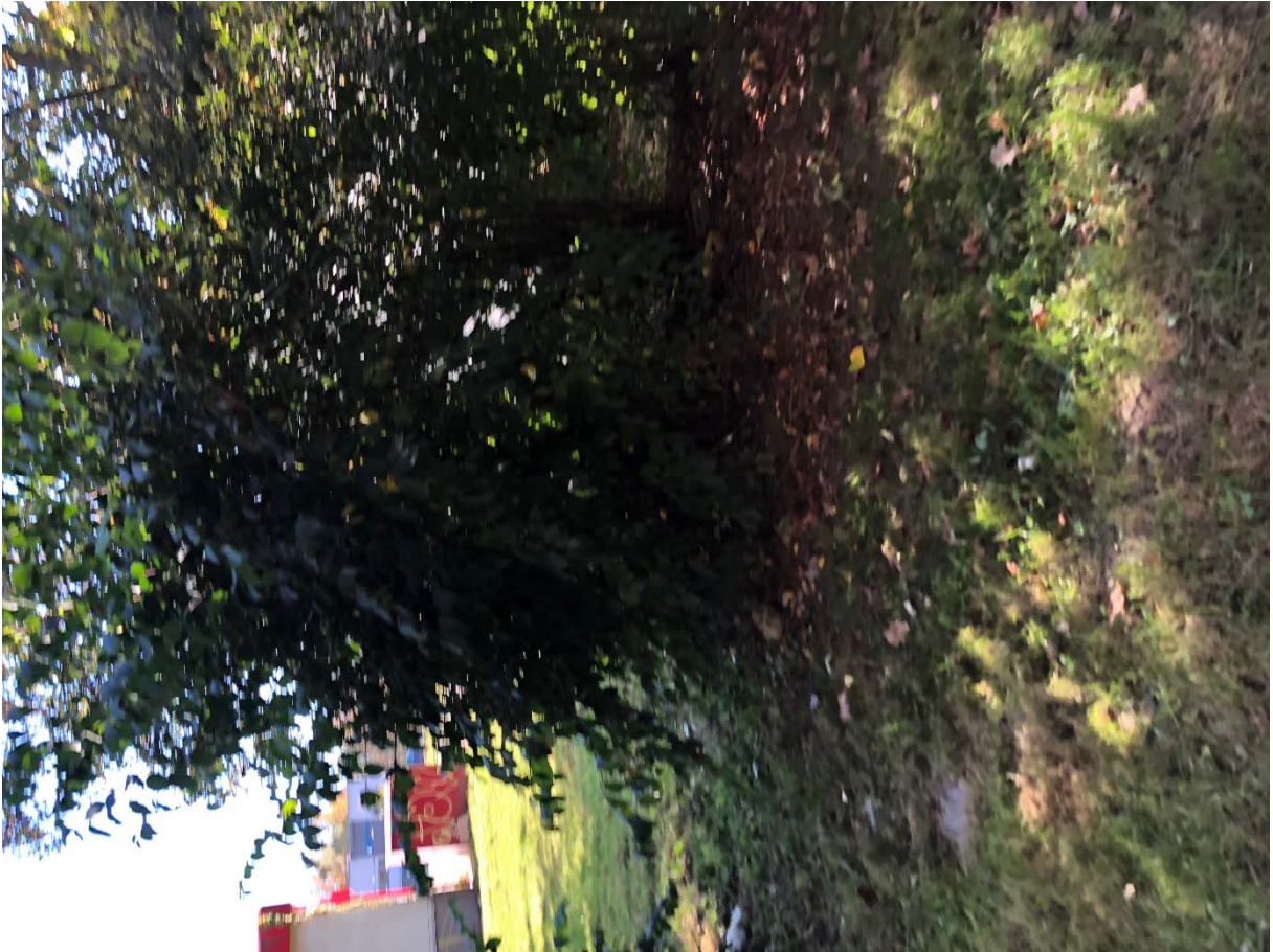
2.) Ulica Tulská