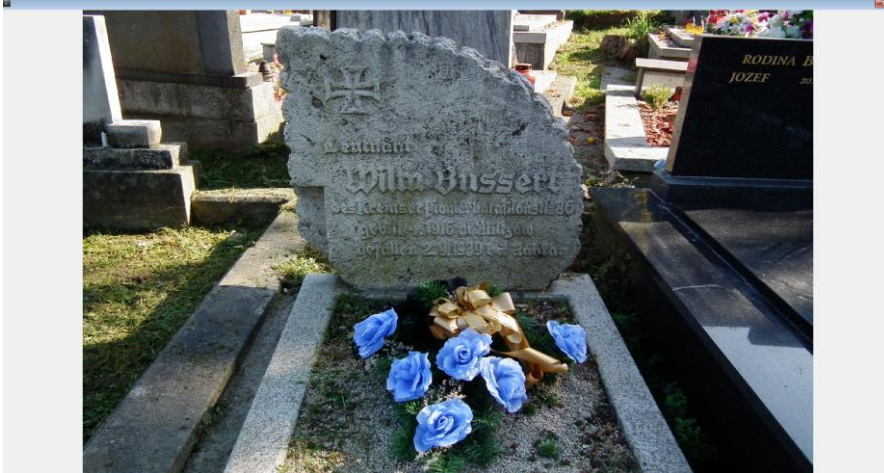
Hrobové miesto v sektore číslo 9, číslo hrobového miesta 1158. Pochovaný Wilm Bussert.

Nemecký dôjstojník poručík Wilm Bussert zahynul ako jeden z prvých vojakov 2. svetovej vojny 2. 9. 1939 v Poľsku, neďaleko slovenských hraníc. Je pochovaný na Starom cintoríne v Žiline. Niektoré písomné zmienky uvádzajú, že by malo ísť o prvú obeť 2. svetovej vojny.