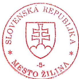
Mgr. Peter Fiabáne primátor

Proti tomuto rozhodnutiu sa podľa § 17 ods. 4 zákona č. 71/1967 Zb. o správnom konaní (správny poriadok) v znení neskorších predpisov nemožno odvolať. Toto rozhodnutie nie je podľa § 7 písm. e) Správneho súdneho poriadku (zákon č. 162/2015 Z. z.) preskúmateľné správnym súdom, ak nemôže mať za následok ujmu na subjektívnych právach účastníka konania. Toto rozhodnutie nadobudne právoplatnosť jeho dorúčením.